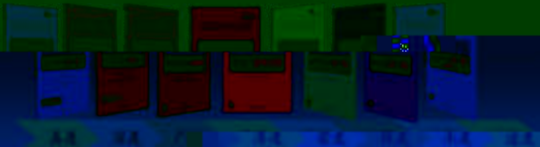
AA 课 件 开 发 技 术 训 练 室